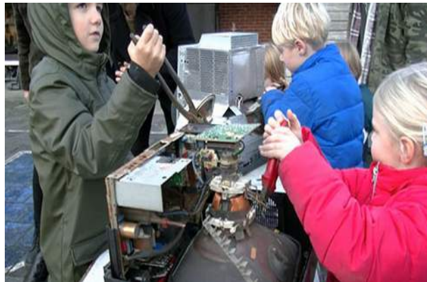
https://vimeo.com/330301422 Workshop tv's slopen, kinderen bezig op het schoolplein