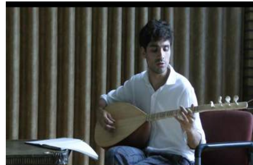
Optreden van Can tijdens finissage https://vimeo.com/351882328