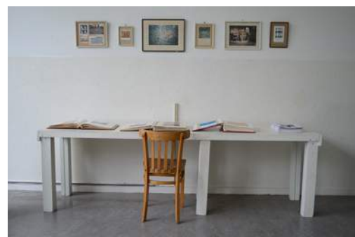
Installatie van Keuter met publicaties, en de Mattheuland kranten