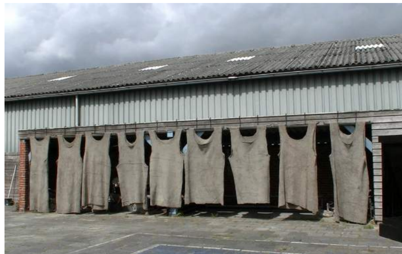
Project eems – Nessos hemden https://vimeo.com/338861362