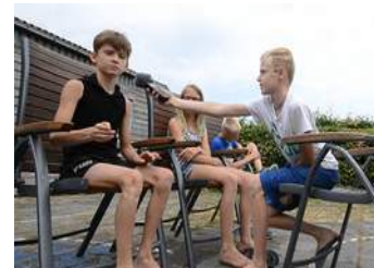
Spontane actie, een interview door kinderen over de Bierumerschool https://vimeo.com/330232862