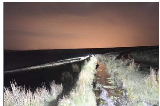
Hugo Braams in residence, 's nachts op pad om foto's te maken in het Eemshaven gebied In de gang