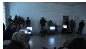
1ste ruimte Zanotta