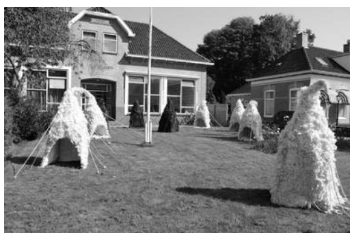
Installatie van Kindt augustus 2016

Een reactie van jonge bezoekers op deze film : https://vimeo.com/319301270