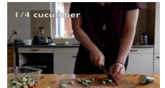
Instants #1 How to make a Salad https://vimeo.com/275844192