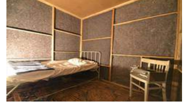
Audio, visuele nstallatie op zolder